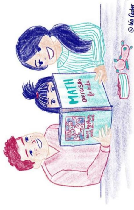
小孩適用的數學練習

这些建议源于此计划的发现以及此计划所建立的网络成员之间的相关讨论。我们从 教师们和家长们 开始着手，因为他们对改变社会对女性在 STEM 中的观点和刻板印象非常重要，同时他们也在小学、中学和高等教育中扮演鼓励女性参与的重要角色。接着针对各种 科学或教育相关组织 提供建议，因为这些才是科学生活每天发生的地方。最后，我们对本研究计划团队成员- 即科学组织 及其他全球组织，提供建议。